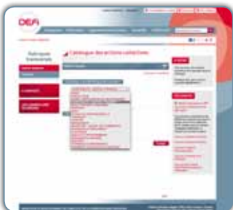
Choisissez votre thème...