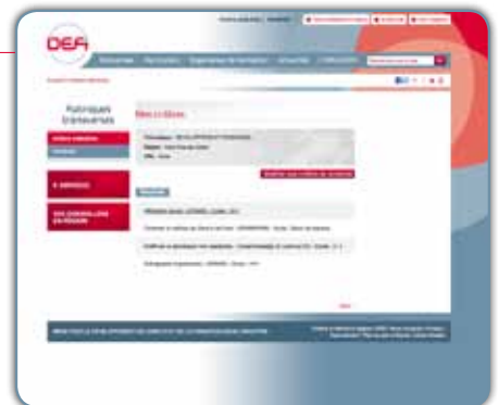
et visualisez les actions disponibles